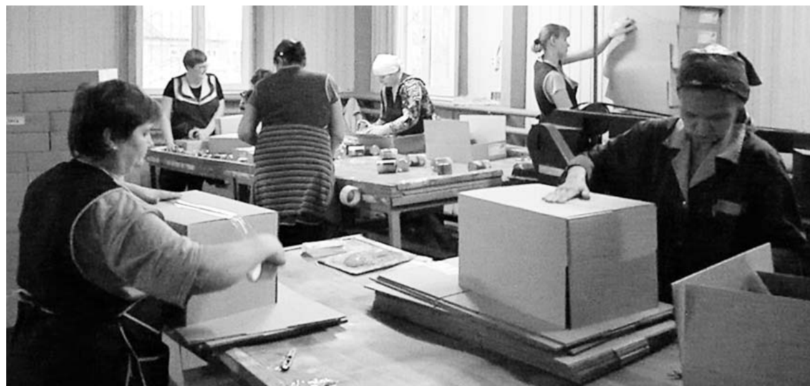
... а в этом — упаковывают.

ция на заводе изменилась кардинально. Да и цифры говорят сами за себя — до ее прихода мы выпускали в сутки до 70 тысяч банок консервов, сегодня — практически 130.